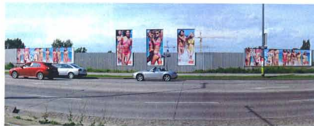
Dominanzstrecke mit hochgestellten Plakattafeln: von Epamedia für Kunde H&M realisiert

Bei Epamedia nennt man als Referenzprojekt im Bereich Sonderwerbformen unter anderem die dreidimensionalen beleuchteten City Lights für AXE. Erzielt wurde der 3D-Effekt mit Hilfe mehrerer geriffelter Acrylscheiben, die übereinander gelegt wurden. Eine weitere Sonderinstallation