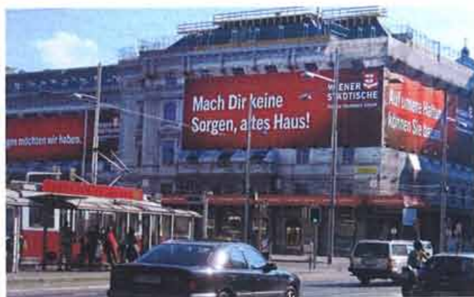
Standortbezogene Werbung wird von Megaboard stark forciert

ourcen ist auch Balloonart als Produktionsunternehmen sehr wichtig: eine Photovoltaik-Anlage am Dach sichert einen Teil der Stromversorgung; wir fahren Fahrzeuge mit Hybridantrieb und entwickeln völlig neue Beleuchtungssysteme für Inflatables auf LED-Basis, um hier den Strombedarf so niedrig wie möglich zu halten. Unsere aufblasbaren Produkte sind zusätzlich klein im Packmaß und daher auch sehr platz-