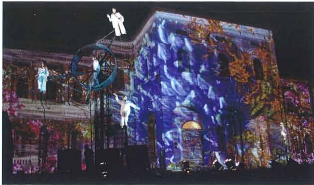
Anlässlich des Unabhängigkeitstages in Singapur illuminierte WEDIA das Nationalmuseum