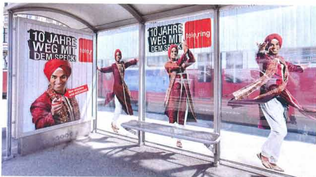
Touch & Sound: Passanten können sich in City Light-Wartehallen der Gewista den tele.ring-Spot anhören