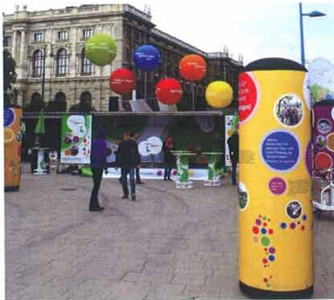
Balloonart Vienna stattet die „klima:aktiv mobil Tour 2010“ aus

Kahmann Frilla Lichtwerbung baut Leuchtschilder, -buchstaben und -displays in allen Größen, Formen und Auflagen – vom Leuchtlogo auf dem Donauturm bis zum Leuchtschild für den „Bäcker am Eck“. Neu im Portfolio sind maßgeschneiderte LED-Lösungen für großflächige, bewegte Anzeigen an Gebäudefassaden. Dazu wird Beratung hinsichtlich des kundenspezifischen Designs, der vollständigen Integration mit dem Gebäude und der hochwertigsten Image-Bild-Darstellung geboten. „Wir sind ein Familienbetrieb und somit das einzige österreichische Lichtwerbungs-Unternehmen, das in allen Produktionsschritten autark ist. Somit haben wir die Qualitätskontrolle und Wertschöpfung im Haus: von Grafik und Druck, über Sandstrahlerei und Kunststoffverarbeitung, bis zum Montagedienst. Wir setzen auf nachhaltige Beziehungen zu allen Partnern. Und wachsen damit auf gesunde Weise: in Österreich, der EU und im Osten“, erläutert Geschäftsführer Michael Kahmann das Erfolgsrezept von Kahmann Frilla Lichtwerbung.