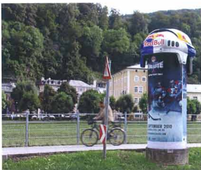
Progress Werbung setzte einer Litfaß-Säule den Red Bull-Helm auf