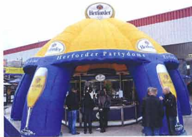
Herforder Partydom: eine Kreation von NO PROBLAIM

Mit dem LED Light System 800 bietet 3M seit Kurzem eine Kombination innovativer Technologien zur gleichmäßigen und wirtschaftlichen Ausleuchtung von Lichtboxen und anderen Lichtinstallationen. In Verbindung mit der ca. 0,15 mm starken 3M Scotchal lichtverstärkenden Folie 3635-100 ist die Lichtausbeute noch effektiver und trägt