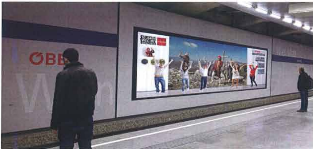
Die ÖBB Werbecenter GmbH testet am Bahnhof Wien Mitte das neue, interaktive Werbekonzept ZIICON-ad

fe, und ermögliche eine zielgruppengenaue Ansprache. „Alle unsere Werbeformen fügen sich in das jeweilige Ambiente ein, sprechen homogene Zielgruppen an und werden autoselektiv konsumiert. Die Marktforschung bestätigt uns, dass ihnen Sympathie entgegengebracht wird und der Begriff Ambient Media positiv besetzt ist. Für uns als Anbieter wird es in Zukunft aber wichtig sein, vermehrt umfassende Werbekonzepte anzubieten. Auch Kreativagenturen sind gefordert Vorschläge zu bringen.“